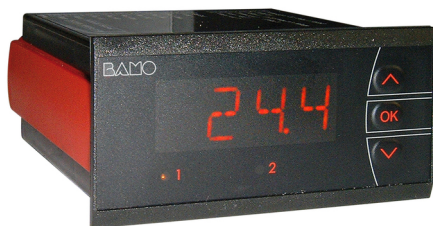
Indicador digital ITU (Opção)