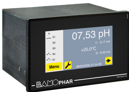
BamoPHAR 107 E : Versão painel (encastrável)