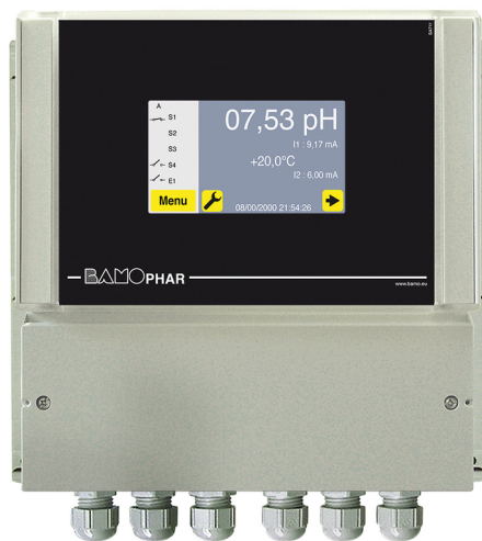
BamoPHAR 107 M : Versão mural