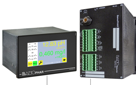
Versão painel + Extensão